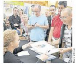
L'an dernier, la 30 e édition de Quai des bulles avait réuni près de 28 000 visiteurs.

Ouest-France lance aussi une « chasse à l'homme ». Les festivaliers, armés de smartphones, devront retrouver à Saint-Malo un inconnu grâce à des codes à flasher et des indices pour gagner des BD.