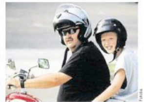
À moto, l'enfant est particulièrement exposé en cas d'accident.

D'abord, il y a toujours 25 % d'accidents dans lesquels des deux-roues motorisés sont impliqués, alors qu'ils ne représentent que 2 % du trafic en France. Ensuite, contrairement à la réglementation, les sièges spécifiques vendus pour les moins de 5 ans transportés à moto, comportent rarement un système de retenue : en cas de choc, l'enfant est projeté vers l'avant.