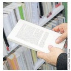
Les prix littéraires boostent les ventes.

Le Renaudot, décerné le même jour que le Goncourt, se vend moitié moins, à 198 000 en moyenne. Il est suivi par le Femina (156 000), Le Goncourt des lycéens (132 000), Le Prix des lectrices de Elle (126 000), Le Prix des maisons de la presse